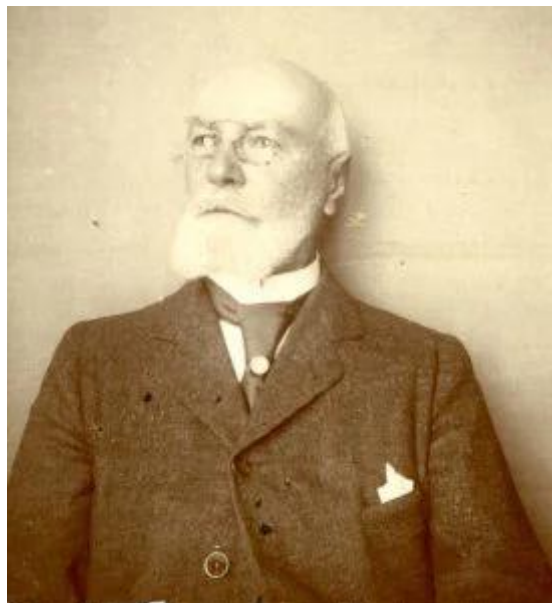
Ο Charles Le Dentu.

Ποτέ ιμπεριαλισμός δεν ασκήθηκε με περισσότερη κομψότητα!»: Με αυτήν τη διαπίστωση έκλεισε ο Κάρολος Λε Νταντύ (Charles Le Dentu) τη μνημειώδη εργασία του για το Πολεμικό Ναυτικό της Αρχαίας Αθήνας. Ο εν λόγω συγγραφέας δεν είχε σχέση ούτε με τις Ανθρωπιστικές Επιστήμες γενικώς, ούτε με την Αρχαία Ελλάδα ιδιαιτέρως. Ήταν Γάλλος, γόνος παλαιάς οικογένειας από τη Νορμανδία, την οποία διέκρινε μακρά παράδοση επιδόσεων σε λειτουργήματα και επαγγέλματα σχετικά με τη θάλασσα.